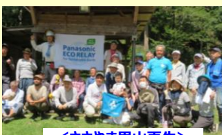
<ささやま里山再生>