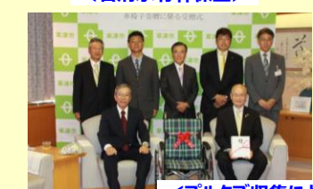
<ブルタブ収集による車椅子の寄贈>