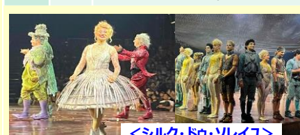
<シルク・ドゥ・ソレイユ>